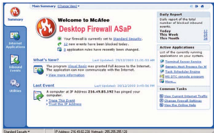
O Desktop Firewall ASaP é distribuído rapidamente a partir de um local remoto para proteger todos os desktops contra ataques de invasores e hackers.

Os relatórios locais mostram como o McAfee Desktop Firewall ASaP está protegendo o usuário, apresentando um histórico das tentativas de invasão. Os relatórios rastreiam todos os eventos de tráfego que entra e sai. Como o Desktop Firewall ASaP monitora o tráfego da Internet, os relatórios detalham as tentativas de hackers, invasores, pings e de qualquer evento potencialmente mal-intencionado que tenha sido detectado e bloqueado pelo serviço gerenciado de firewall.